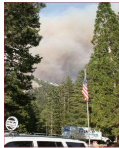
L'incendie près de notre lieu de Retraite à Idyllwild