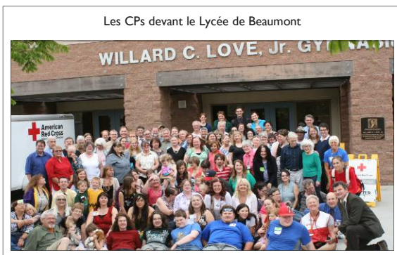
Les CPs devant le Lycée de Beaumont

Idyllwild en Californie, les actualités parlaient des incendies incontrôlés dans cette zone, mais des appels téléphoniques au site